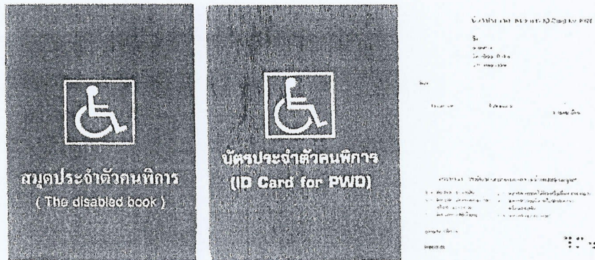
ตัวอย่างบัตรและสมุดประจำตัวคนพิการ

กรณีได้รับเบี้ยยังชีพคนพิการอยู่แล้วและได้ย้ายเข้ามาในพื้นที่ลุ่มระวี จะต้องมาขึ้นทะเบียนที่องค์การบริหารส่วนตำบลบือระ อีกครั้งหนึ่ง ภายในวันที่ 1 - 30 พฤศจิกายน